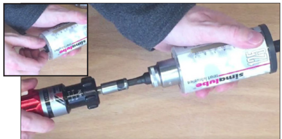
Antriebskopf einschrauben und mit 1,5-2,0 Nm festziehen