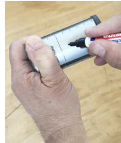
Spender mit Füllung kennzeichnen