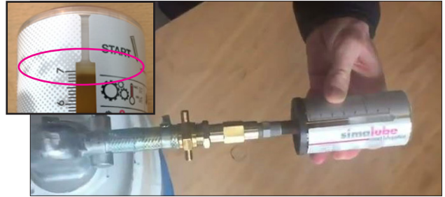
simalube auf Füllnippel stecken und Öl bis zur oberen Markierung pumpen. ⚠ NICHT ÜBERFÜLLEN!