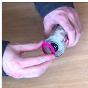
Adhiera la pegatina magenta