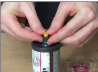
Inserta la válvula retenedor de aceite amarilla