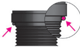
Verifique la posición de la junta tórica